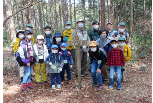
清水山山頂での記念撮影